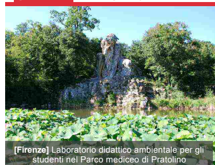
[Firenze] Laboratorio didattico ambientale per gli studenti nel Parco mediceo di Pratolino