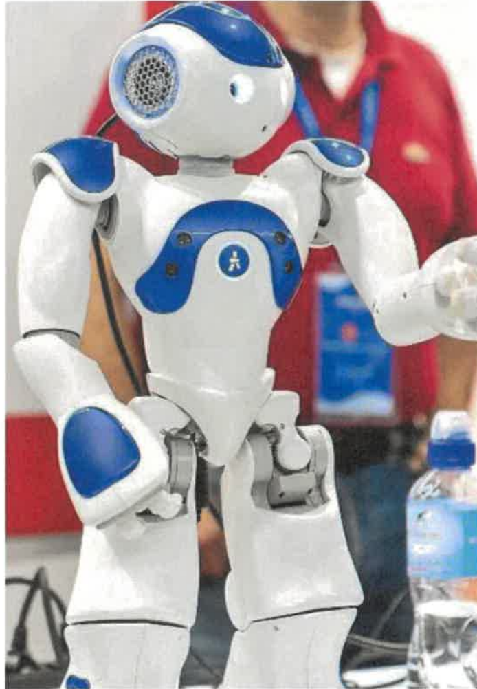
La Fiera Didacta propone ogni genere di innovazione. In alto: Lorenzo Becattini