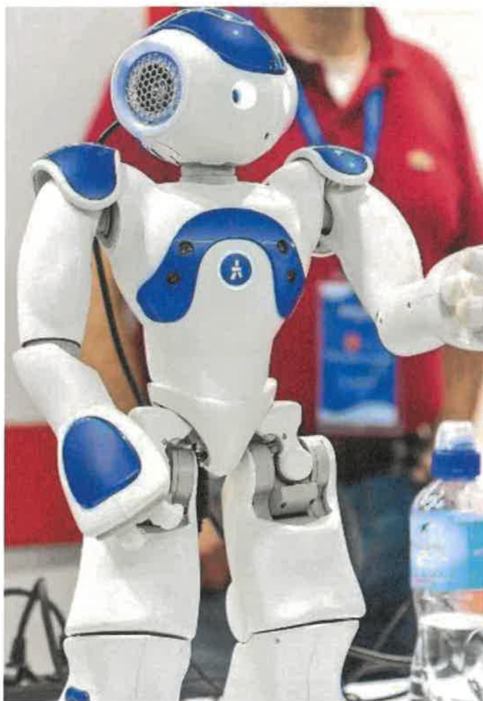
La Fiera Didacta propone ogni genere di innovazione. In alto: Lorenzo Becattini