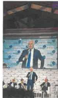
Didacta inaugurata dal presidente della Regione Eugenio Giani

Nel suo saluto, l'assessora Nardini ha sottolineato che "questa fiera che punta sull'innovazione è un messaggio importante in questa fase di ripartenza. Le nostre ragazze e i nostri ragazzi hanno pagato il prezzo più salato di questa pandemia e a loro abbiamo il dovere di dare risposte".