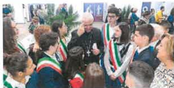
La prima giornata La cerimonia inaugurale o il taglio del nastro con le autorità e i piccoli sindaci; sono 75 le aziende espositrici, oltre 270 gli eventi formativi