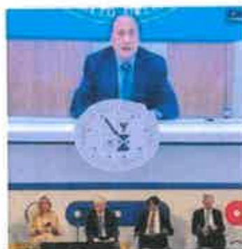
Renato Schifani L'intervento del presidente in collegamento