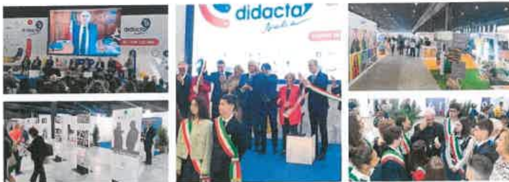
La prima giornata. La cerimonia inaugurale e il taglio del nastro con le autorità e i piccoli sindaci; sono 75 le aziende espositrici, oltre 270 gli eventi formativi

► 21 ottobre 2022 - Edizione Reggio Calabria